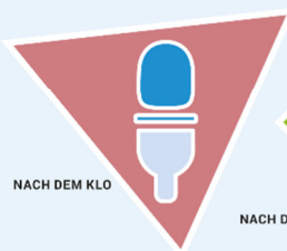
NACH DEM KLO