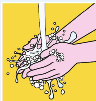
HÄNDEWASCHEN NICHT VERGESSEN