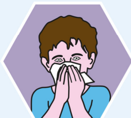
IN EIN PAPIERTASCHENTUCH