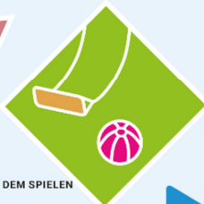
NACH DEM SPIELEN