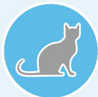
NACH DEM KONTAKT MIT TIEREN