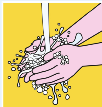
HÄNDEWASCHEN NICHT VERGESSEN