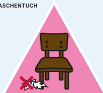
NICHT RUMLIEGEN LASSEN