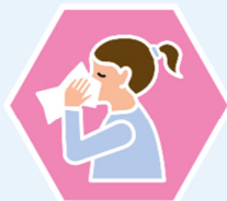
NACH DEM NASEPUTZEN